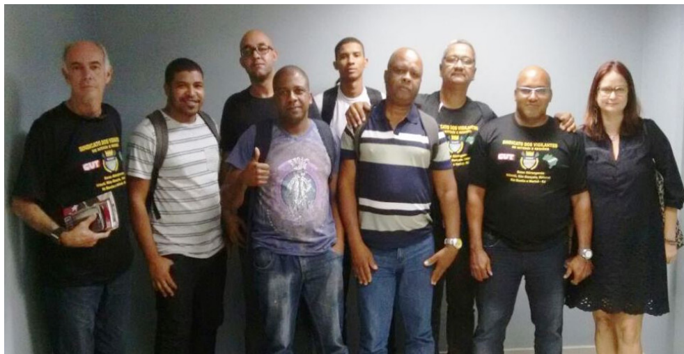
O Sindicato foi contra o parcelamento das rescisões conforme proposto pela empresa

A direção do Sindicato dos Vigilantes de Niterói, São Gonçalo e Região (Svnit) conquistou mais uma vitória em prol dos trabalhadores nesta sexta-feira (17). Em reunião no Ministério Público do Trabalho (MPT) de Niterói com a empresa Facility e a contratante dos serviços de vigilância, Imprensa Oficial, a empresa se comprometeu a pagar todas as rescisões integralmente dos 24 vigilantes demitidos. A data para a quitação é até o dia 24 de julho.